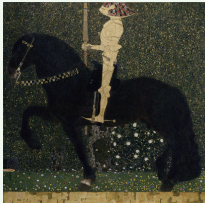
[芸術の都ウィーンとデザインの潮流] グスタフ・クリムト《人生は戦いなり(黄金の騎士)》1903年 愛知県美術館蔵