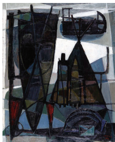
[生誕100年記念能登正智展] 能登正智《農機具》1953年 当館蔵