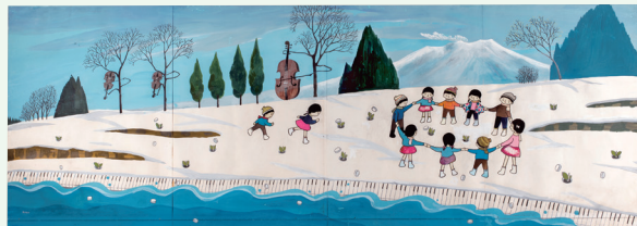
[壁画《芽の出る音》50年記念 谷内六郎展] 谷内六郎《芽の出る音》原画 知内町中央公民館蔵