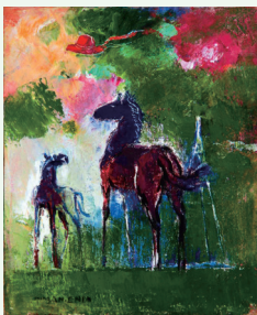
[動物の絵] 遠藤ミマン《赤い帽子と馬の親仔》1975年 当館蔵